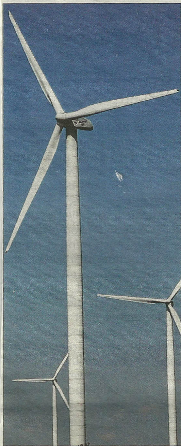
Abgelehnt. Neudorf bekommt keine neuen Windrad-Zonen.