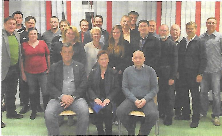
Die Bürger-Arbeitsgruppen werden das gemeinsam erarbeitete Dorferneuerungsleitbild am Freitag vorstellen.